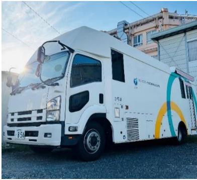
健診バス③号車 ついに仲間入り！